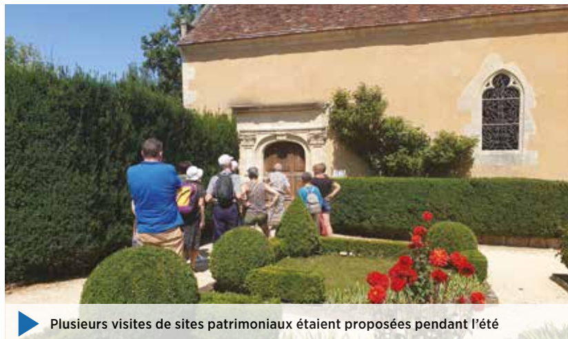
Plusieurs visites de sites patrimoniaux étaient proposées pendant l'été

De l'avis de l'ensemble des professionnels du tourisme de la 4CPS (hébergeurs, restaurateurs...), la saison touristique a été positive sur le territoire de la communauté de communes, notamment grâce à une météo globalement favorable.