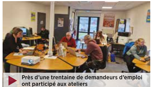
▶ Près d'une trentaine de demandeurs d'emploi ont participé aux ateliers

En 2025, une trentaine de demandeurs d'emploi ont bénéficié de quatre ateliers animés par les conseillers de France Travail autour de l'usage des outils numériques de France Travail et de l'immersion facilitée. Pour cette nouvelle année, les thématiques des ateliers devraient évoluer afin de répondre plus précisément aux attentes du public.