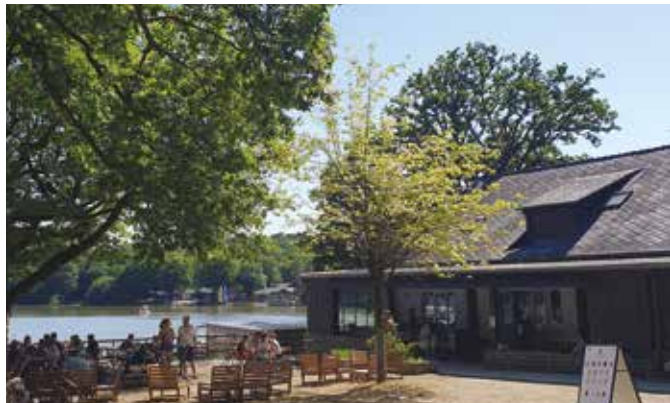
Des touristes et des habitants séduits par la nouvelle formule de l'Embarcadère

Dans les mois à venir, la communauté de communes, propriétaire du bâtiment, va continuer à accompagner l'évolution de l'établissement en réalisant la réfection des fenêtres et des bardages extérieurs.