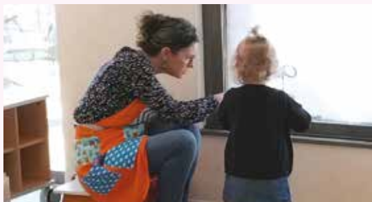
Deux professionnelles animent chaque session

Accessible gratuitement, le LAEP est assuré par des professionnelles du service Petite Enfance de la communauté de communes, accompagnés de professionnelles d'organismes partenaires : CAF (Caisse d'Allocations Familiales), Espace Afajes, ADAPEI (Association Départementale des Amis et parents de personnes ayant un handicap mental), EPSM (Établissement Public de Santé Mentale) ... Celles-ci interviennent en binôme, en alternance, selon les différentes sessions.