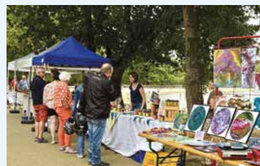
Un exceptionnel marché des producteurs et des artisans pour fêter les 100 ans de Coco Plage

Toutes ces manifestations, très bien relayées par les médias, ont donné un beau coup de projecteur sur le site.