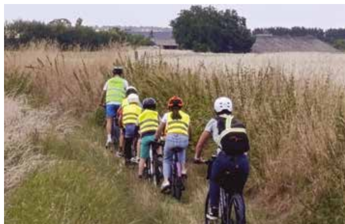
Validation du permis vélo après une belle balade

Le 11 avril 2025, les ALSH de la 4CPS ont ainsi participé au départ de la dernière étape du Région Pays de la Loire Tour, qui se déroulait au Lac de Sillé. Une belle occasion d'admirer les champions cyclistes tout en prenant conscience des précautions que les coureurs doivent respecter pour circuler en toute sécurité.