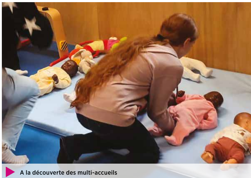
▶ A la découverte des multi-accueils

Dès maintenant, les jeunes souhaitant participer à l'édition 2026 peuvent se faire connaître auprès du service actions sociales de la 4CPS ou de l'Espace Afajes.