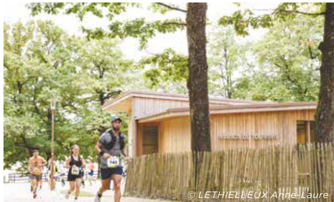
Nouvelle épreuve sportive et populaire : le premier trail du Lac de Sillé s'est déroulé le 27 septembre

Cette première expérience encourage les élus et les techniciens à poursuivre cette ouverture vers le tourisme sportif.