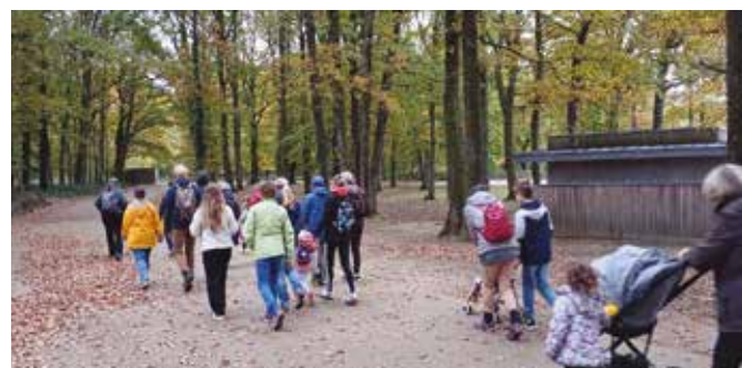
▶ Une Balade Santé pour nouer des liens entre familles