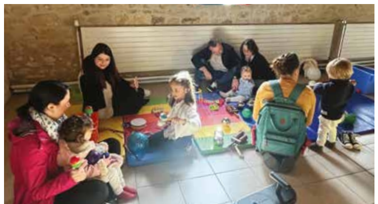
Un espace sensoriel était proposé pour les plus petits

Pour chaque événement, la 4CPS fait appel à des partenaires locaux. Elle bénéficie aussi du soutien de la Caisse d'Allocations Familiales, de la Mutualité Sociale Agricole et de l'Espace Afajes. Ces projets multipartenaires s'inscrivent dans la Convention Territoriale Globale, en particulier dans la démarche de qualité.