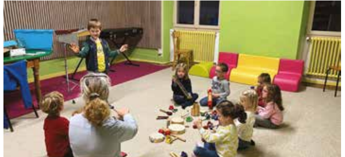
Les cours sont dispensés à Domfront-en-Champagne les mardis, mercredis et jeudis après-midi.