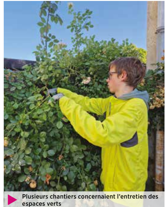
▶ Plusieurs chantiers concernaient l'entretien des espaces verts