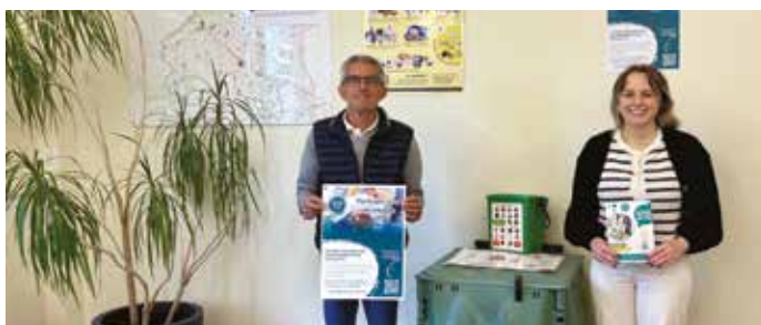
Des documents de communication ont été publiés pour accompagner les habitants dans l'évolution de la collecte