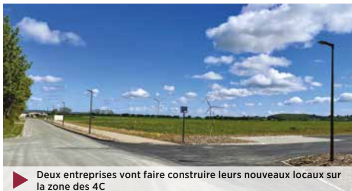
Deux entreprises vont faire construire leurs nouveaux locaux sur la zone des 4C